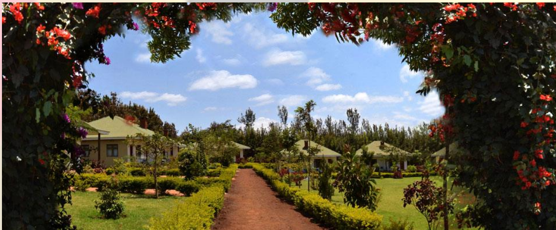
NGORONGORO COUNTRY LODGE