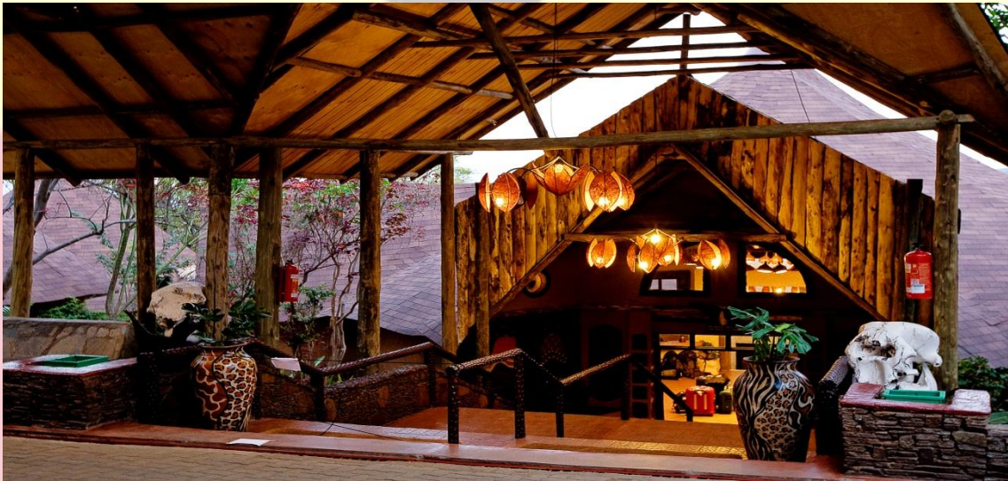
MARA SOPA LODGE