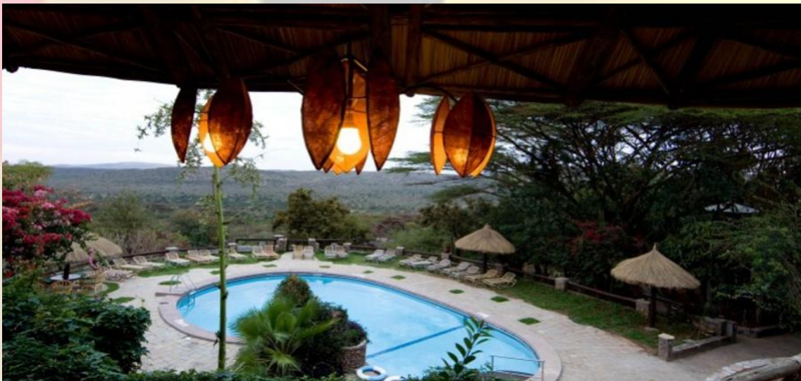
MARA SOPA LODGE