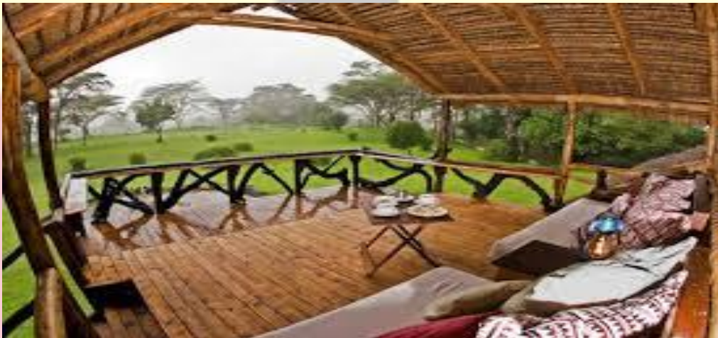
BASE CAMP EXPLORER MASAI MARA